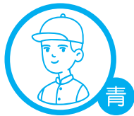
青少年導師證書課程