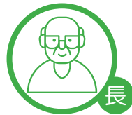
長者導師證書課程