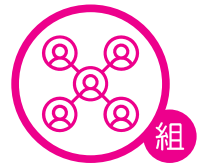
小組組長導師證書課程

目的 提供自主、具彈性的學習平台，為有心志參與兒童、青少年、長者事工及小組組長服事的信徒，提供更整全、具系統的裝備。