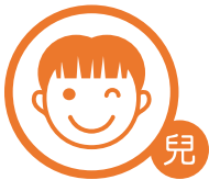
兒童導師證書課程