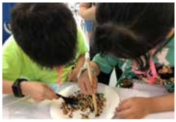
聚精會神完成挑戰