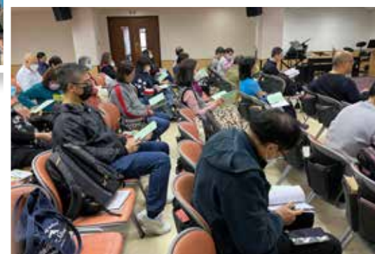
營友聚精會神研讀聖經