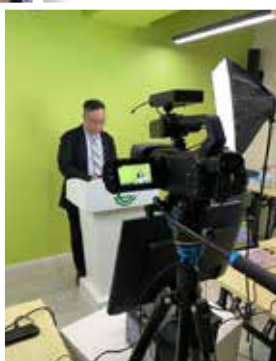
9月份聚會的拍攝現場