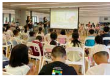
親親天父靈修時間