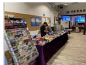
第 95 屆「港九培靈研經會」（轉播站）書攤