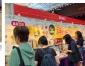
第 39 屆「基督教聯合書展」