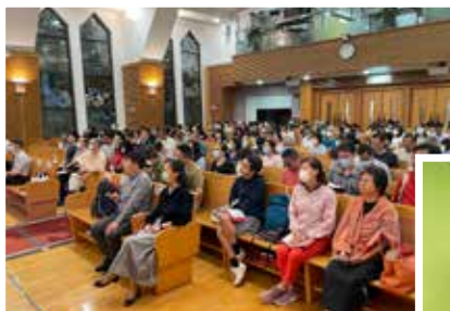
7月份聚會的人數增加