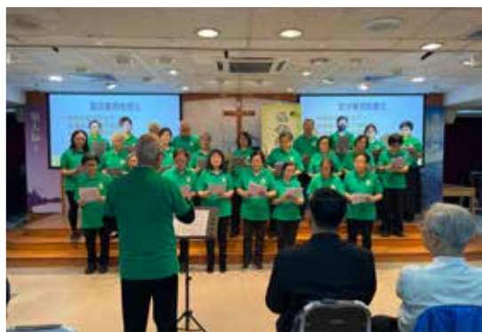
聖公會聖士提反堂樂齡事工部獻詩