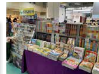
播道會恩福書室主辦 「喜迎聖誕書籍及精品展 2023」